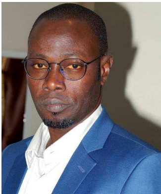
DIENG Dame Dakar Sénégal

Je souhaite mettre mes connaissances à disposition de l'AIPU afin d'améliorer les conditions de travail de mes collègues.